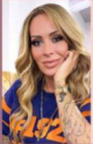
CORA SCHUMACHER Vorwürfe an Ex-Mann Ralf