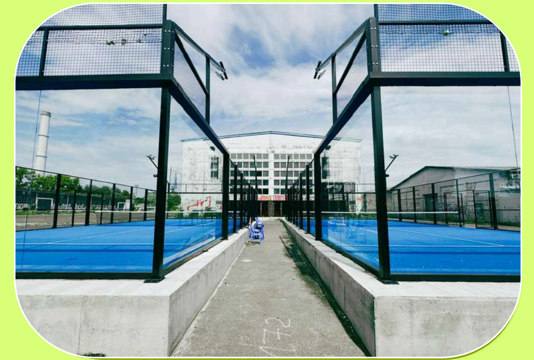
PADEL FC, BERLIN